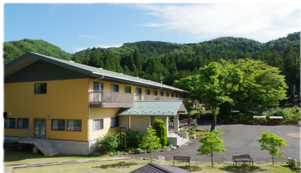
写真 日光オーリーブの里 栃木県日光市佐下部 368 /TEL 0288-21-7693

CLIは神学校ではありませんので、牧師や宣教師を養成する学校ではございません。CLIはクリスマンとしていかに生きるかを探究する学びを通じ、他者がキリストと結ばれて生きられるよう支援するクリスマンメンターを養成する学校です。詳しくは本書の「2. クリスマンライフ学院の目指すこと」をご覧ください。